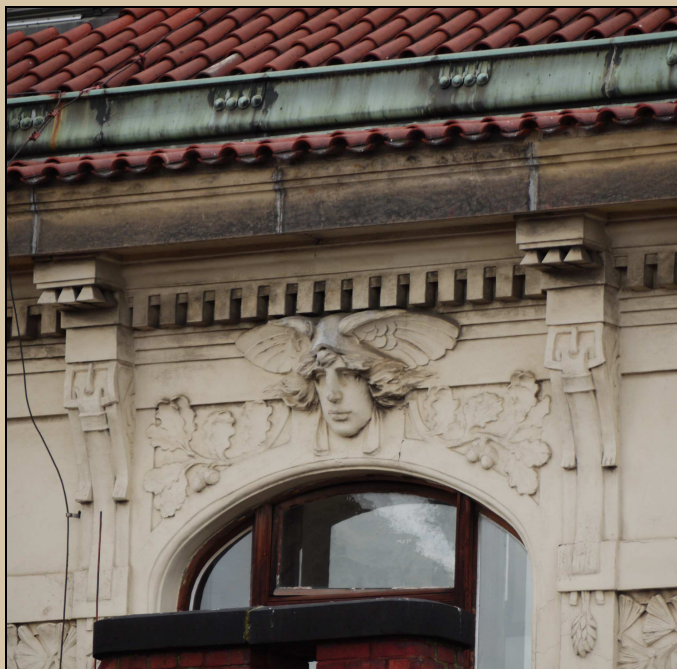
Stav v roce 2017